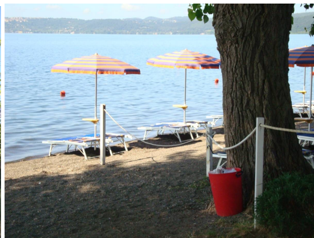
Laghi inaccessibili, il caso di Bracciano

Nel caso del lago di Martignano , tutti e due gli accessi sono possibili solo dietro una forma di pagamento: l'accesso dalla via Trevignano-Anguillarese è possibile solo dopo aver pagato il parcheggio (raggiungerlo a piedi è arduo), tutto da verificare perché ubicato in una area sottoposta a vincoli paesaggistici; dall'altro lato, dalla via Cassia, c'è un agriturismo che fa pagare l'accesso alla spiaggia.